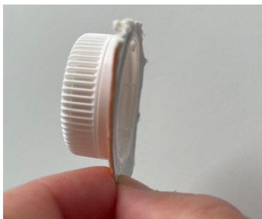
Le bouchon idéal