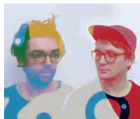
Joasihno by Habermann André